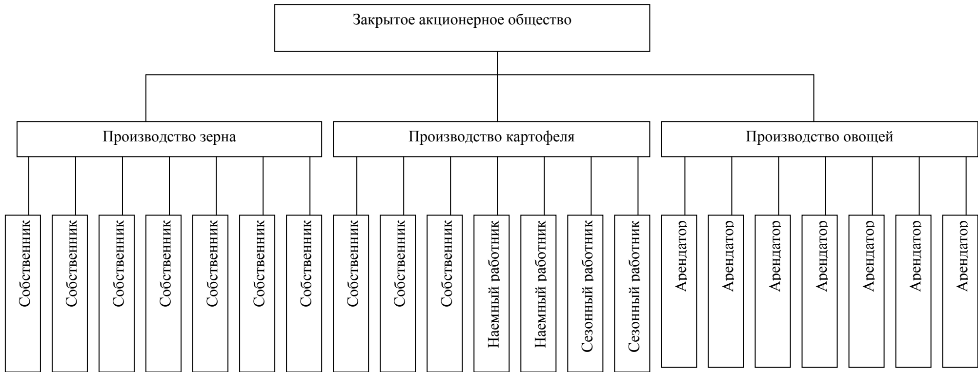
Рисунок 1 – Организационная структура объектов