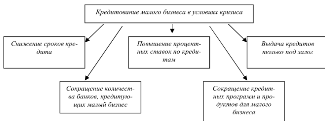
Рисунок 3- Кредитование малого бизнеса в условиях кризиса [9]

Основной проблемой явился растущий дефицит финансовых ресурсов. Кредитование малого бизнеса за последнее время претерпело существенные изменения (рисунок 3).